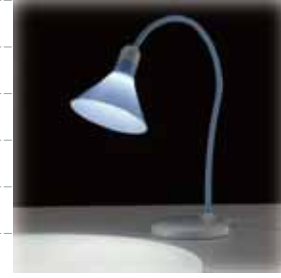
シェードからこぼれる優しいあかり